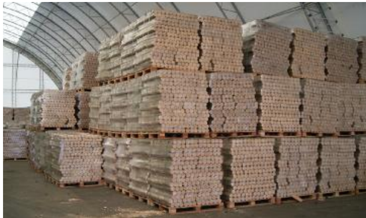
Holzbriketts in einer Lagerhalle

Von August bis Dezember 2008 wurden 194 Stichproben nach verschiedenen Kriterien, überwiegend aber messtechnisch untersucht, wobei eine Stichprobe 20 bis 80 Stück Einzelpackungen umfasst. Die Probenziehung erfolgte in den Betriebsstätten, in Lagern bzw. im Handel.