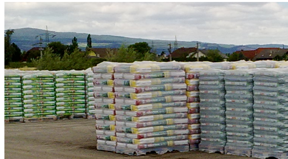
Fertigpackungen auf Paletten

Von Februar bis einschließlich Juli 2010 wurden 68 messtechnische Kontrollen durchgeführt.