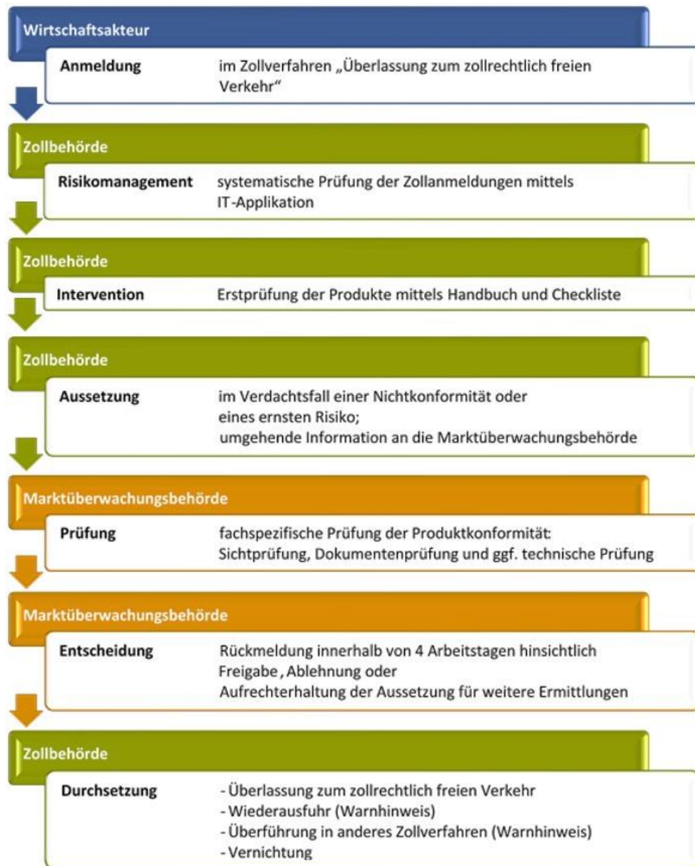
Abbildung 1 Flussdiagramm

Auf europäischer Ebene fördern Leitlinien der Kommission und die geplante Reform des Zollkodex eine strukturierte Zusammenarbeit zwischen Zoll- und Marktüberwachungsbehörden, einschließlich Austausch von risikorelevanten Daten und Durchführung gemeinsamer Kontrollen. National sind Zuständigkeiten und Verfahren klar geregelt, um Verdachtsfälle effizient zu bearbeiten und unionsweit konsistente Standards sicherzustellen.